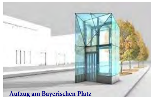
Aufzug am Bayerischen Platz

Wenn alles glatt läuft, kann die Inbetriebnahme des Aufzuges im U-Bahnhof Bayerischer Platz bis Ende diesen Jahres erfolgen, wie die BVG auf Anfrage mitteilt. Die Kosten für den Einbau betragen rund 5 Millionen Euro. Auch sonst geht es mit dem barrierefreien Ausbau des Umsteigebahnhofs voran. Die Rohbauarbeiten sowie die Erneuerung der Bahnsteigplatte auf der U7 sind fast abgeschlossen, die halbseitige Sperrung des Bahnsteigs ist mittlerweile wieder aufgehoben. Der Aufzug wird auf dem Mittelstreifen der Grunewaldstrasse gesetzt, um für beide Linien erreichbar zu sein.